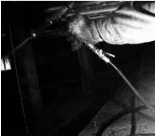
床下木部処理作業

●新政権で沖縄県の基地の移転問題が国民的課題になっている。日本の米軍基地が75%も集中する沖縄県は、県民が安心して生活できる最低条件を遥かに超えている。沖縄県には10回ほど行っているが大げさと言えば県内を歩いて飛行機の爆音がベースに有り街の雑音、森の小鳥の鳴き声、浜辺は波音が辛うじて聞こえる感じた。●普天間基地の問題はアメリカの理論・理屈で話をすすめるところに問題はないか。県民・国民の理論で移転先を考へるべきではないか。米軍機墜落、暴行殺人、米軍交通事故など枚挙に暇がない。ほかに基地の経費負担も。なぜ、悲惨な事件と県民(国民)犠牲が集中するのか。根底には1951年サンフランシスコ講和条約と共に誕生、同60年に改定された「日米安保」条約がある。●日本国民は、これによって経済・文化・教育・政治を従属的に押し付けられている。十条からなる条約は、第十条に「何れかの国が廃棄通告すれば1年後には自然に廃棄される」となっている。スタートから59年、安保条約締結から50年、国の進路を決める基本条約。政権は、条約廃棄に向けた交渉をするのが先決ではないだろうか。