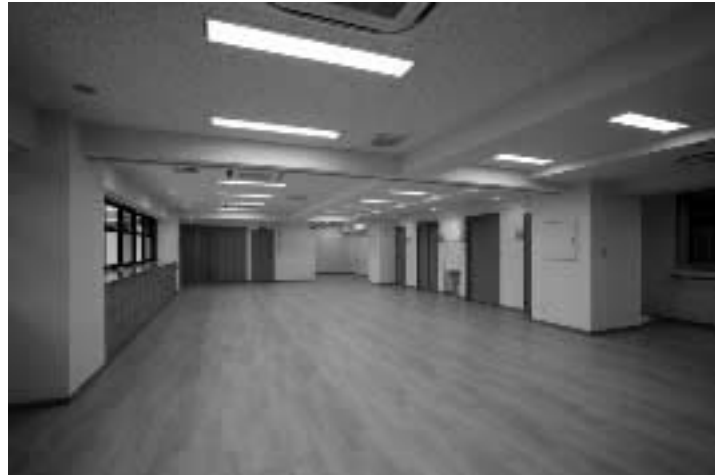
多目的1階ケアステーション