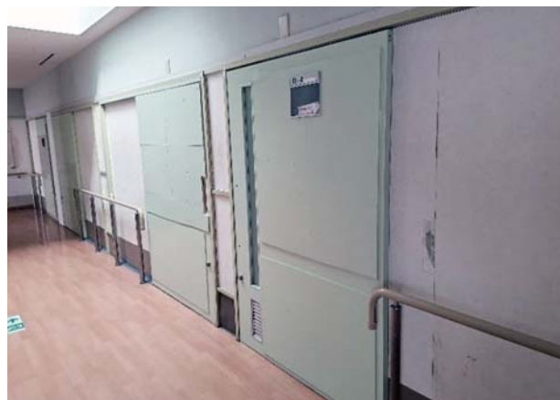
ベニヤ板を打ち付けていた扉は塗装で一体に