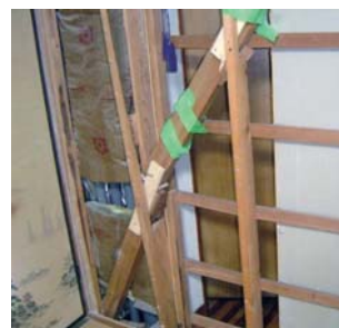
地震で折れた筋交い(熊本地震)

「家屋が倒壊・崩壊しない」とされていますが、これは、こうした震度でも建物が損傷しないということではなく、「すぐには倒壊・崩壊せず避難時間が確保できる」というだけにすぎません。 何度も強い地震が繰り返し発生した場合には倒壊・崩壊の恐れが十分にありません。2016年(平成28年)の熊本地震や今回の能登半島地震では、震度7の地震が2度連続して起きたために倒壊したり、当初の地震では大丈夫そうにみえた住宅がその後の震度4の地震で倒壊した例が起きています。 地震の揺れに耐えるために設置される「耐力壁」は、筋交い等で柱や土台、梁等が外れたりすることを防いでいますが、一度大きな地震が来るとこれらの接合部が外れたり筋交いが折れたりし、2度目の地震の際に機能を果たさなくなっている事例がみられます。