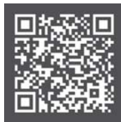
市町村の補助金一覧 (県HP)

また、各市町村が独自に設定した様々な種類の補助金もあります。各市町村のホームページで確認する等、県住宅課のホームページで各市町村の補助の種類を見ることがもできます。