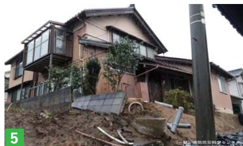
①1階部分が斜めに傾いた住宅 ②亀裂の入った地面のアスファルト ③建物危険判定「倒壊注意・立入禁止」 ④大きく傾いた建物 ⑤敷地と道路の間に大きな段差ができた住宅