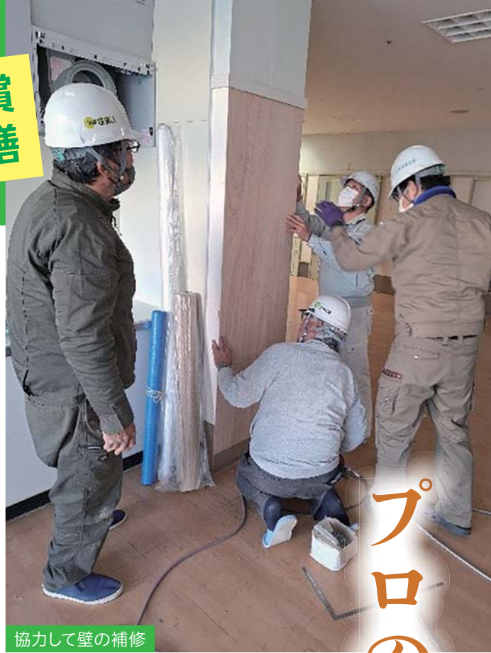
協力して壁の補修

今回修繕を行った箇所は、ドアや壁が大きく傷み劣化が目立っていました。しかし、施設側では運営資金が限られており、