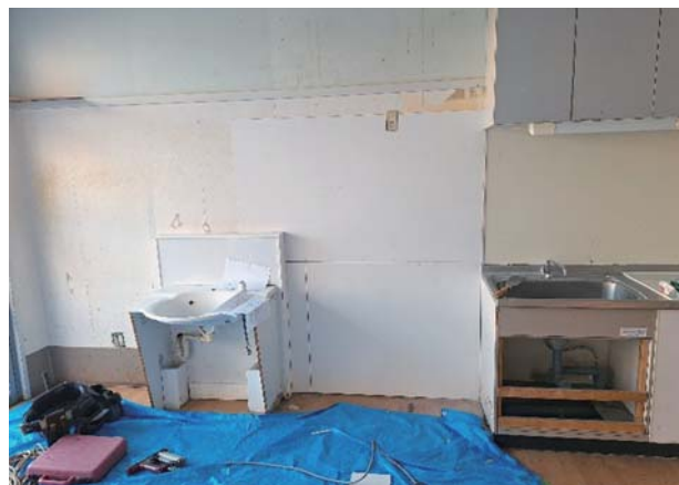
破損し穴が開いた壁部分は板を当てて元通りに