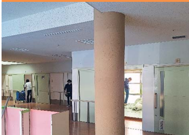
壁紙が剥がれていた柱は塗装で補修